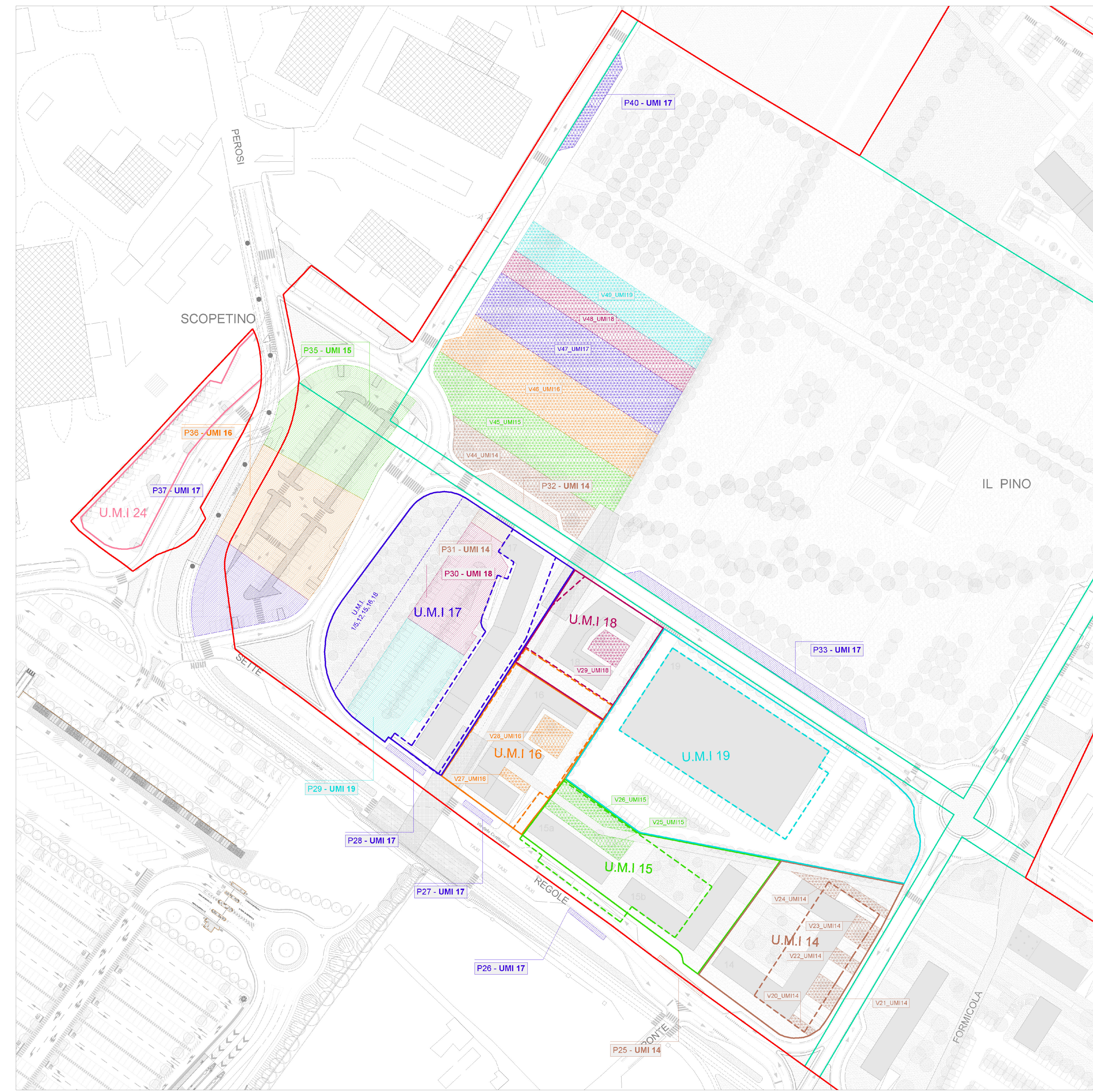
Individuazione delle urbanizzazioni correlate alle Unità Minime di Intervento