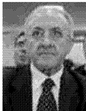
Vincenzo De Luca

«L'assessore regionale? Spetta alla sua sensibilità decidere se adesso è il caso di andare avanti»