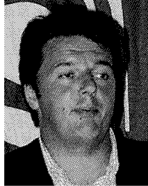
Il governatore Enrico Rossi Sotto il sindaco di Firenze Matteo Renzi