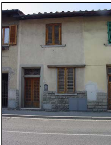
Rilevatore Serena Barlacchi