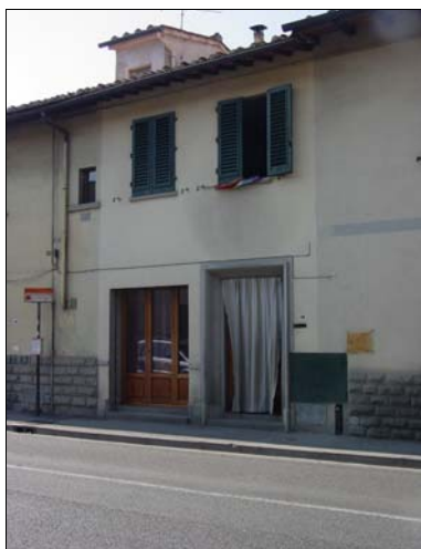
Rilevatore Serena Barlacchi