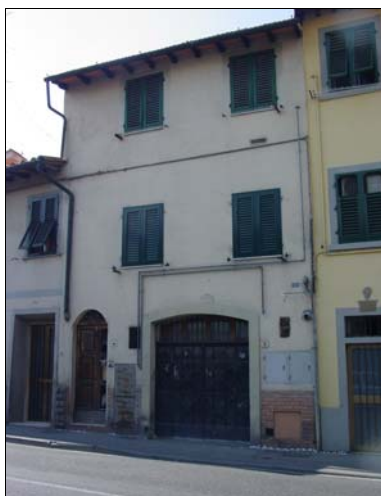
Rilevatore Serena Barlacchi