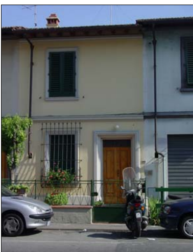
Rilevatore Serena Barlacchi