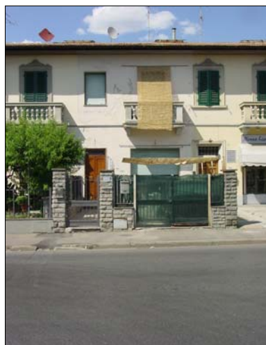
Rilevatore Serena Barlacchi