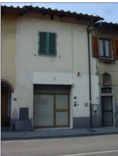
Rilevatore Serena Barlacchi