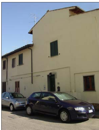
Rilevatore Serena Barlacchi