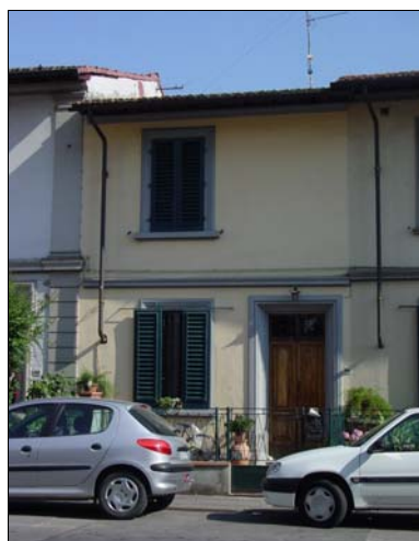
Rilevatore Serena Barlacchi