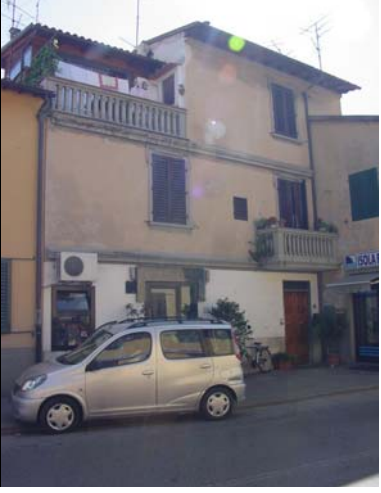
Rilevatore Serena Barlacchi