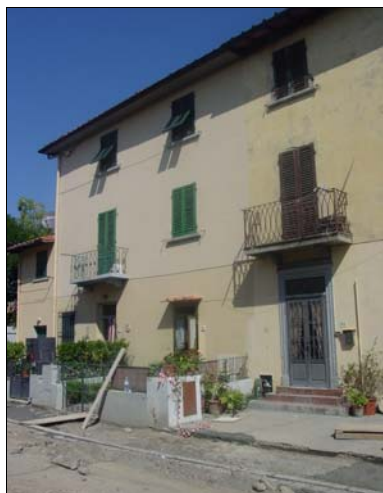
Rilevatore Serena Barlacchi