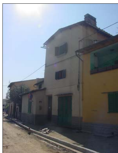
Rilevatore Serena Barlacchi