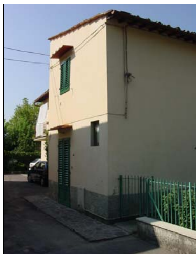
Rilevatore Serena Barlacchi