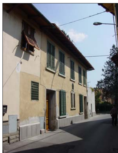
Rilevatore Serena Barlacchi