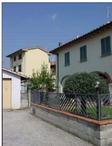
Rilevatore Serena Barlacchi