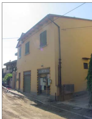
Rilevatore Serena Barlacchi