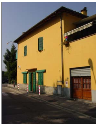
Rilevatore Serena Barlacchi