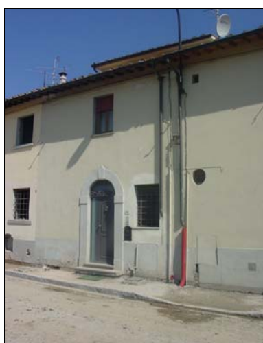
Rilevatore Serena Barlacchi