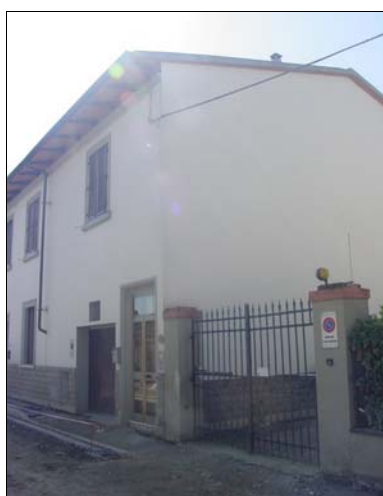
Rilevatore Serena Barlacchi