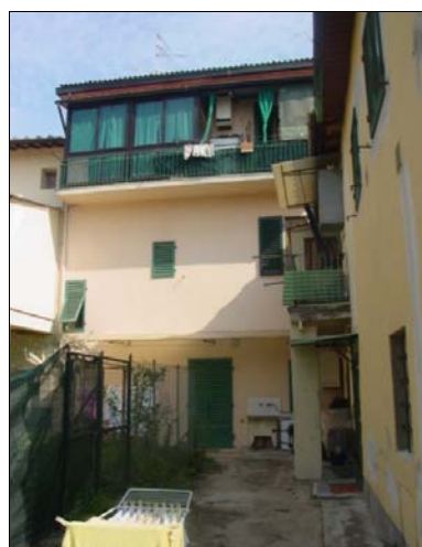
Rilevatore Serena Barlacchi