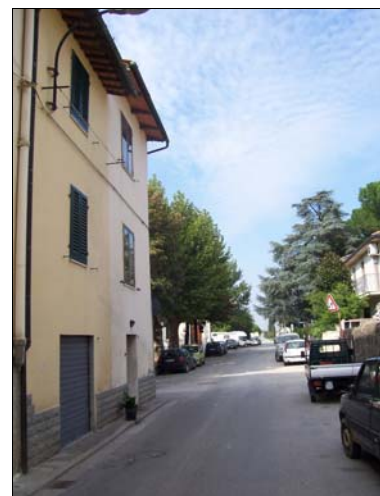
Data di rilevazione 13/10/2005