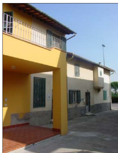
Rilevatore Serena Barlacchi