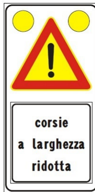
Figura Il 391c Art. 31