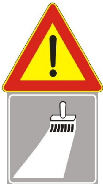
Figura Il 391 Art. 31